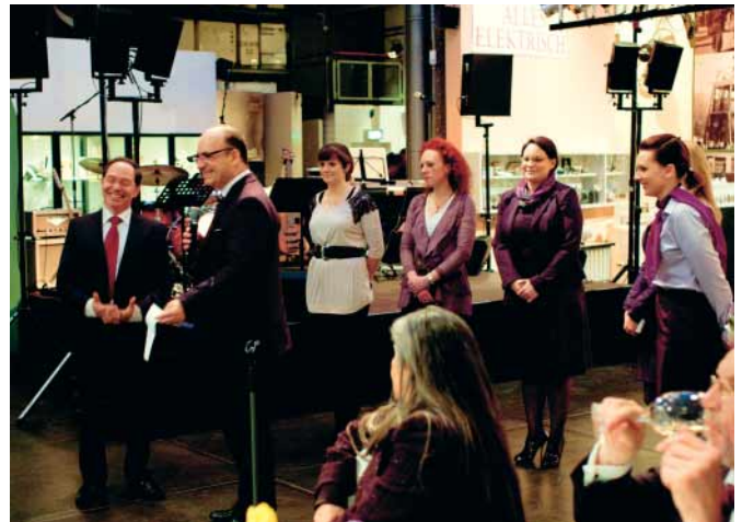
Der DVO-Vorstand und die OSTAK bedanken sich herzlich für sein langjähriges Engagement