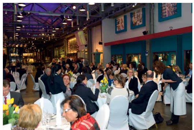
Der Gesellschaftabend in besonderer Kulisse im Museum für Industriekultur in Nürnberg