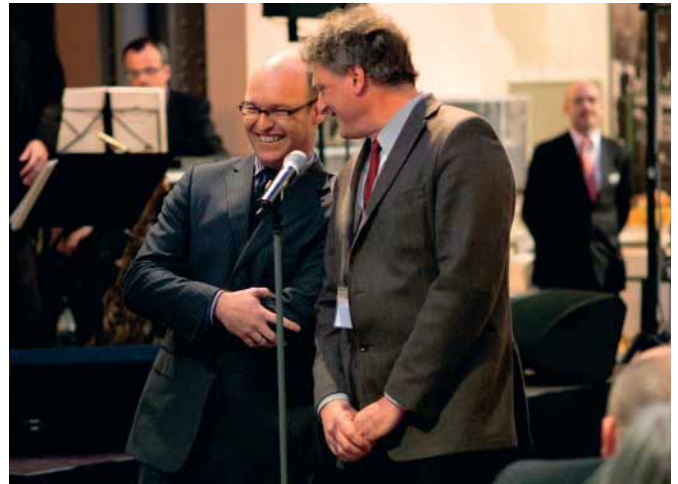
Die Kongresspräsidenten danken allen herzlich für den erfolgreichen Kongress