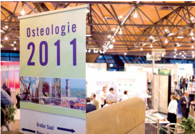
Kongress OSTEOLOGIE 2011 vom 24.–26. März 2011 in der Stadthalle in Fürth