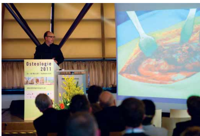
Vielseitige Themen zogen eine große Schar von 1400 Fachbesuchern in die Stadthalle nach Fürth